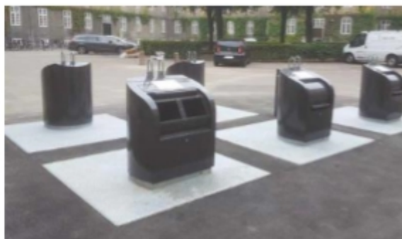
Billede af delt Evolution XL indkæsthus & Evolution L indkæsthus